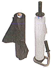
Allgemein saubere Verpackungsfolie