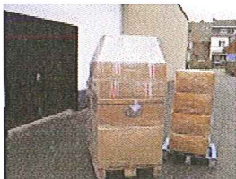
Umverpackungen von Paletten